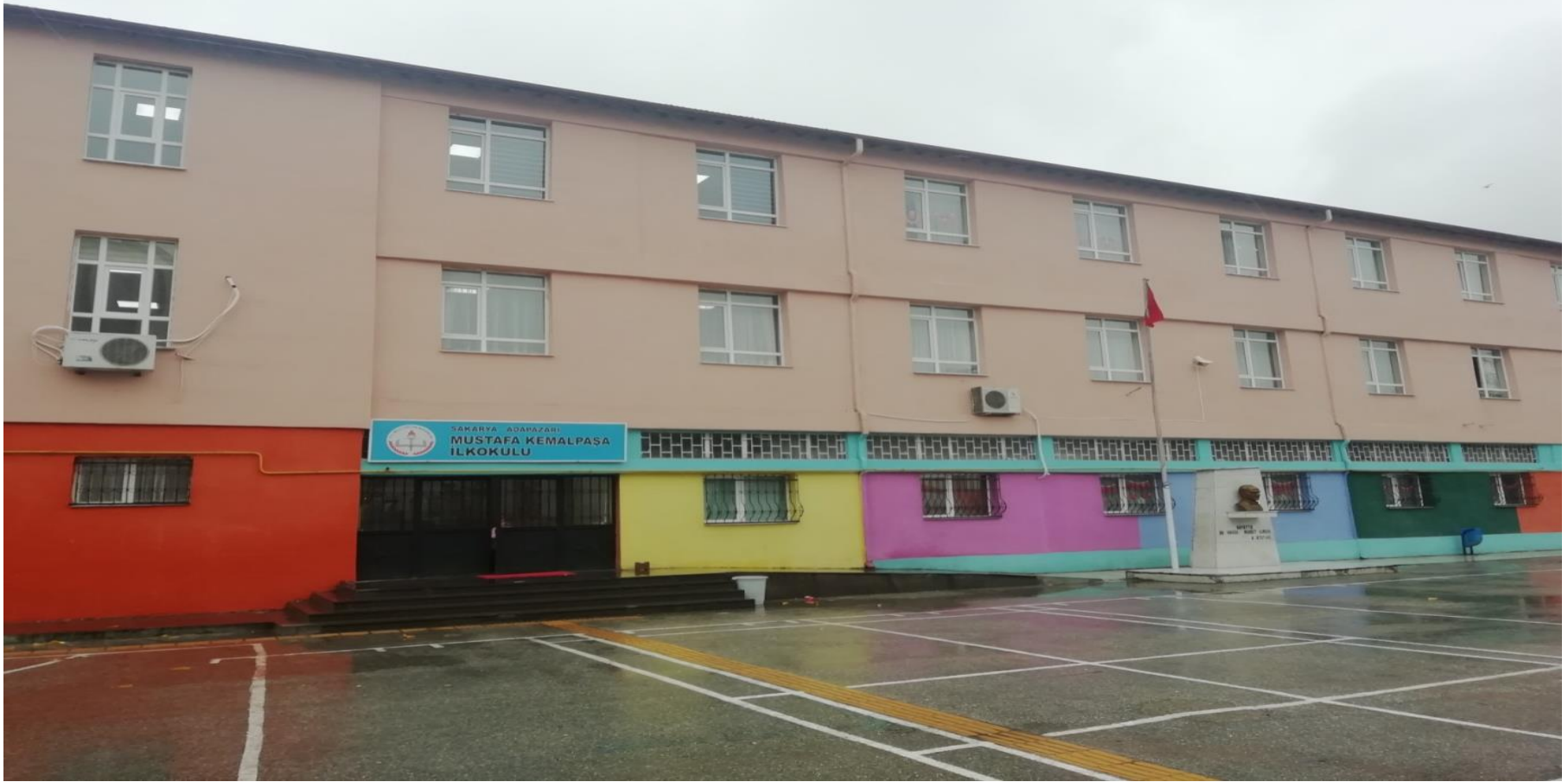
MUSTAFA KEMALPAŞA İLKOKULU